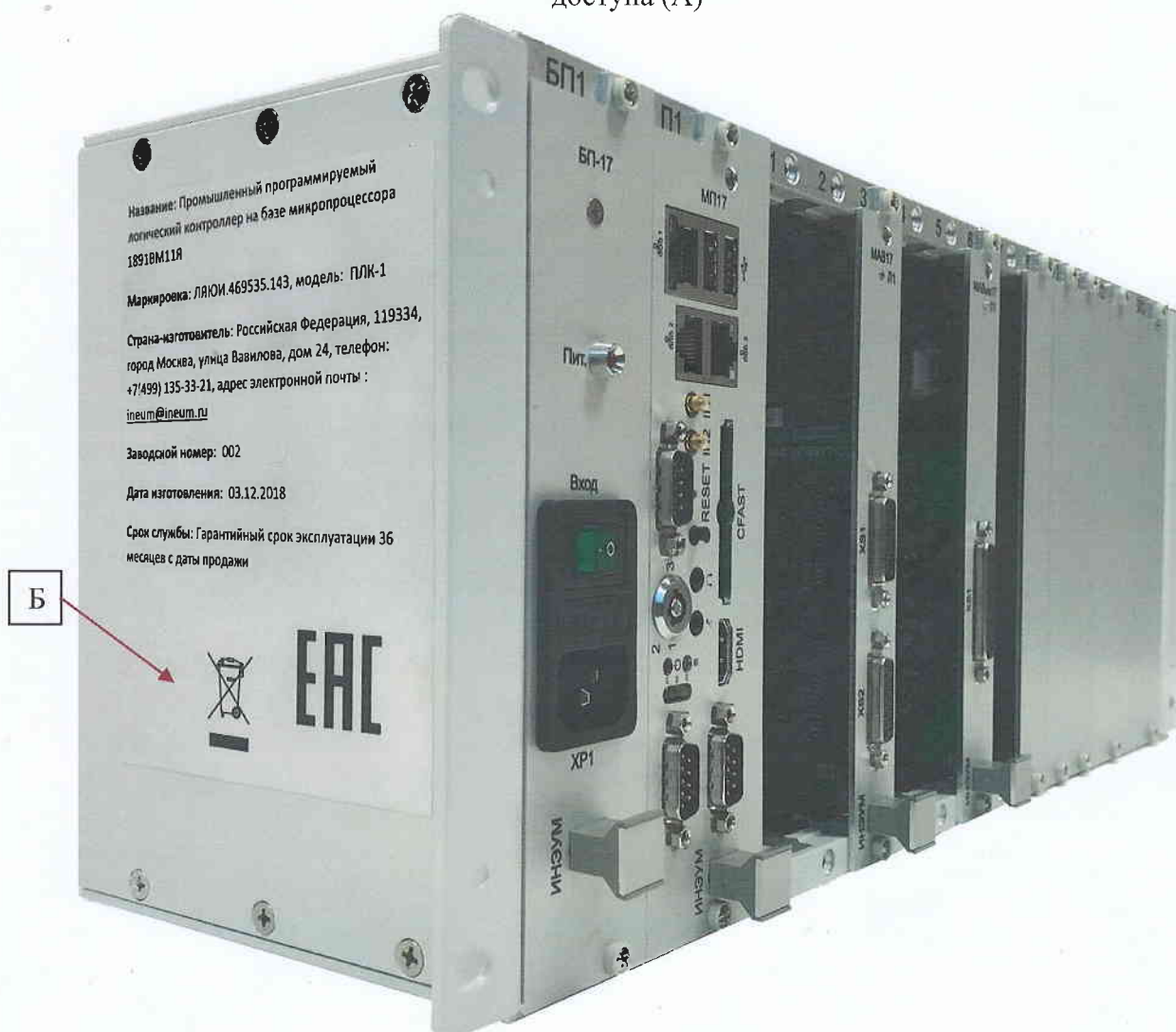
Рисунок 2 – Место нанесения знака утверждения типа (Б)